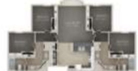
Quad Private Room Dimensions