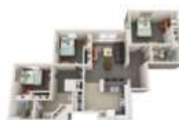
Triple Floor Plan