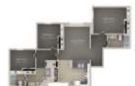
Triple Room Dimensions