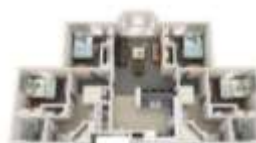
Quad Private Floor Plan